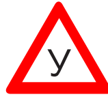
Учебное транспортное средство